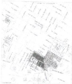
Quedas do Iguaçu-PR, 03 de Maio de 2023.

FAZ SABER aos que vivem ou dele tiverem conhecimento, que se acham depositadas em seu Cartório, as autos contendo os documentos exigidos da Lei nº 4.730 de 19.12.76 para o registro do "LOTEAMENTO URBANO MISERICORDIA".